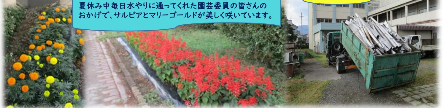
夏休み中毎日水やりに通ってくれた園芸委員の皆さんのおかげで、サルビアとマリーゴールドが美しく咲いています。