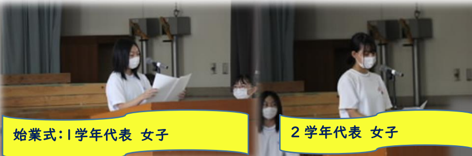
始業式：1学年代表 女子