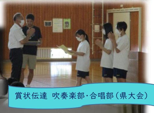
賞状伝達 吹奏楽部・合唱部(県大会)

各学年代表者の皆さんが2学期の抱負を発表してくれました。 委員としてクラスへの呼びかけをもっと頑張りたい、毎日の挨拶を自分からすることを心がける、部活動を充実させたい、不撓不屈の精神で、飛翔祭に向けて最後の合唱をクラスみんなで創り上げ、良い思い出をつくりたい、テストの記述問題対策など、苦手克服に取り組みたい・・・など、それぞれの皆さんが前向きな思いを述べてくれました。