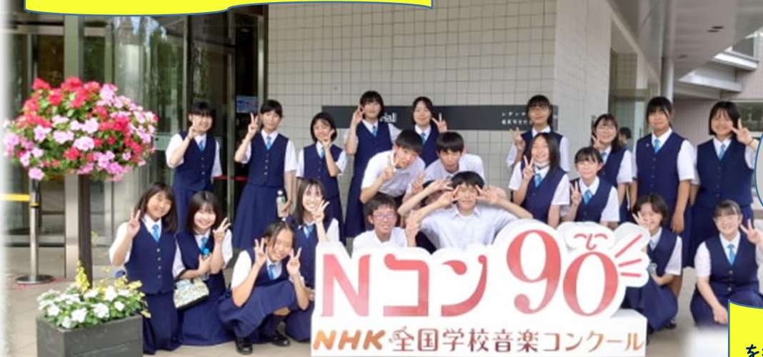
合唱部県大会 レザンホールにて記念撮影

猛暑が続き、熱中症警報が「危険」の数値31を超える日も多くありました。 皆さんは暑さに負けず、部活の練習に励んでいました。 時には自主練のために早朝から学校に来ている皆さんにも会いました。