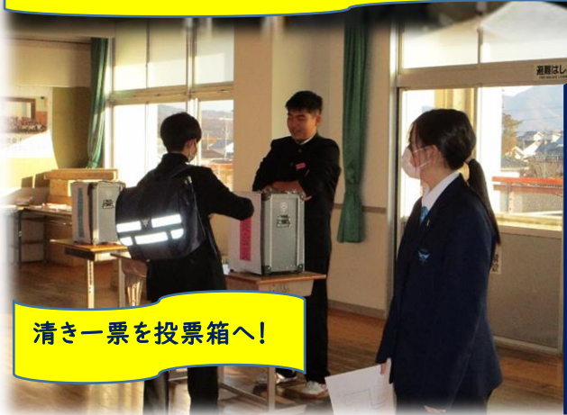
清き一票を投票箱へ！

☺インフルエンザの流行により、体育館での立会演説会を変更し、オンラインでの演説会となりました。候補者たちは各学級を訪問し、自信をつけてきました。本番では、分かりやすく明朗な声で立候補への思いや公約を訴えてくれました。 ☺第37期生徒会長には [ ] さん、男子副会長に [ ] 女子副会長に [ ] さんが選出されました。全校の皆さんと共に、2年生らしいフレッシュな生徒会を創り上げていってほしいです。