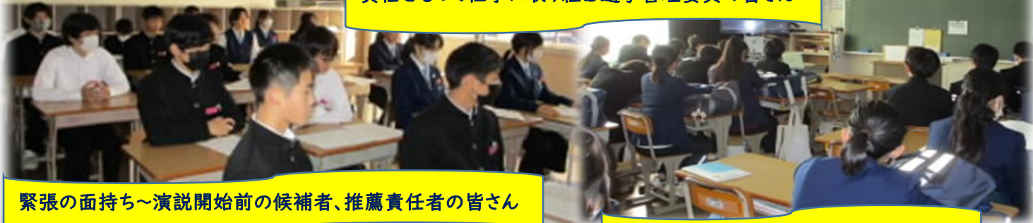
緊張の面持ち～演説開始前の候補者、推薦責任者の皆さん