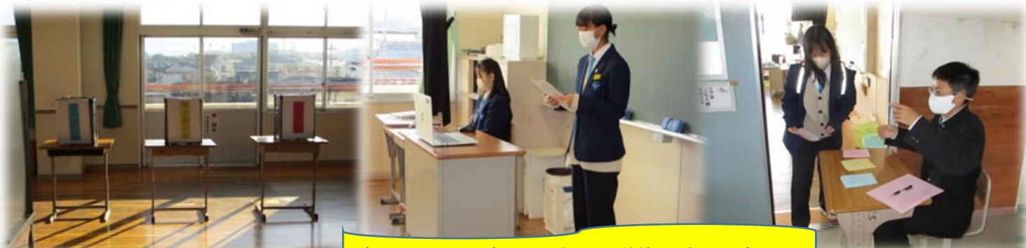
責任をもって仕事に取り組む選挙管理委員の皆さん